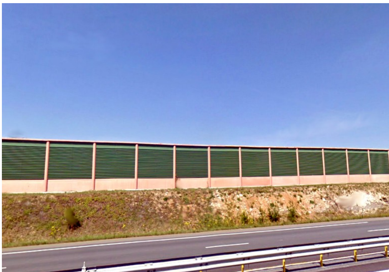
Belfort et Pérouse, écrans anti-bruit sur l'A36