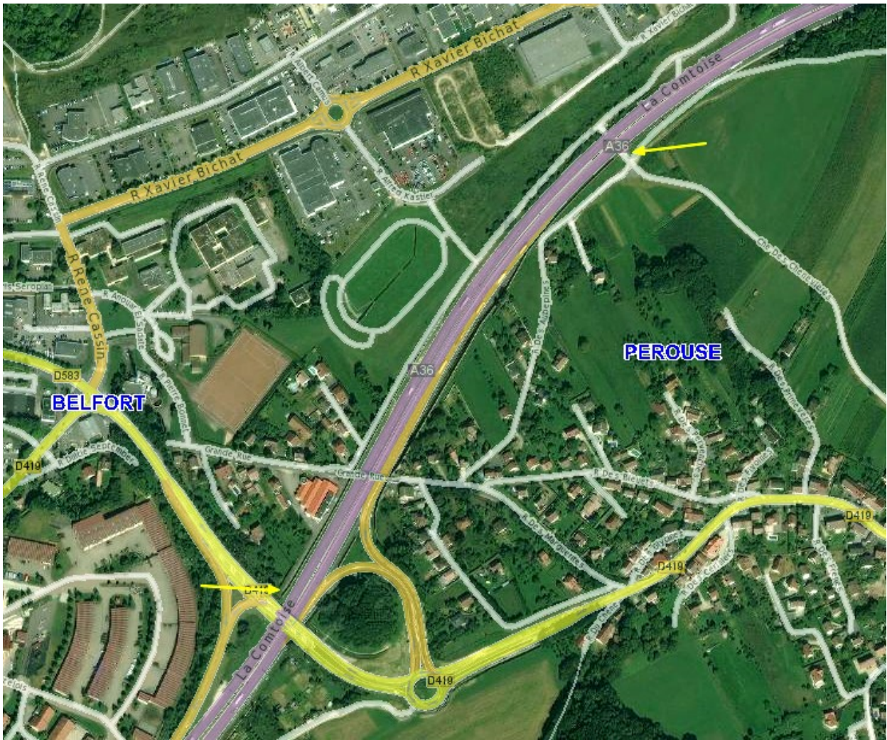
Belfort et Pérouse, écrans anti-bruit sur l'A36